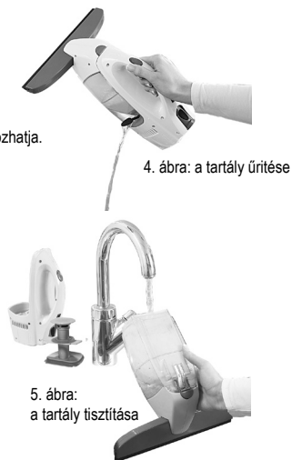
5. ábra: a tartály tisztítása